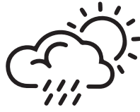
MÉTÉO ET CLIMAT