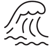
OCÉANS ET LACS