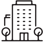
VILLES ET PERSONNES